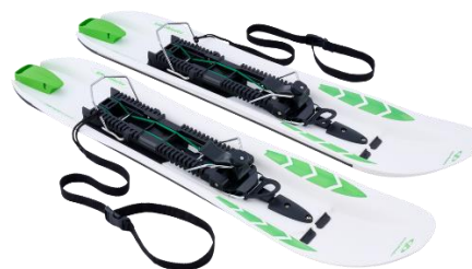
Crossblades con attacchi Hardboot